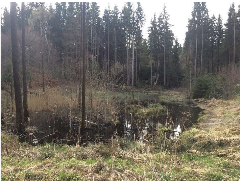
Abb.7: Toteisloch, von LBV und Forstbetrieb München freigestellt