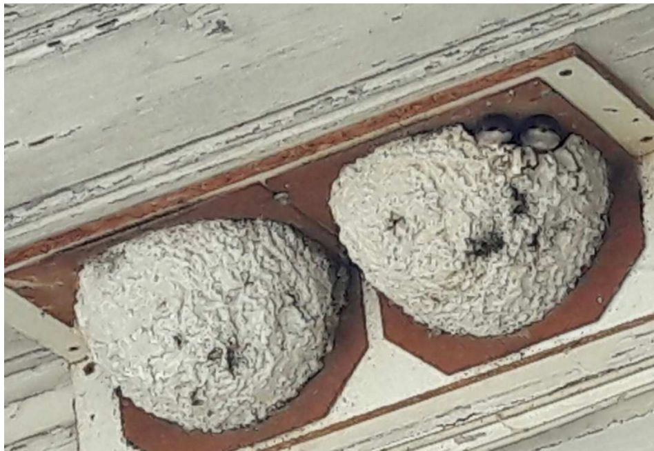
Junge Mehlschwalben im Kunstnest