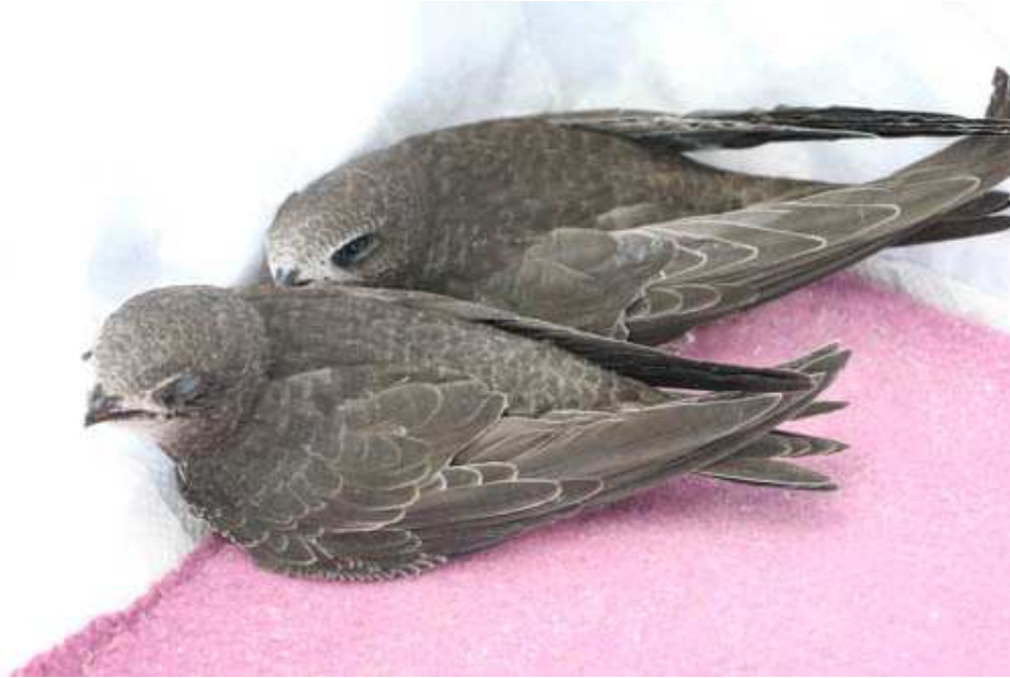
Junge Mauersegler in Pflege