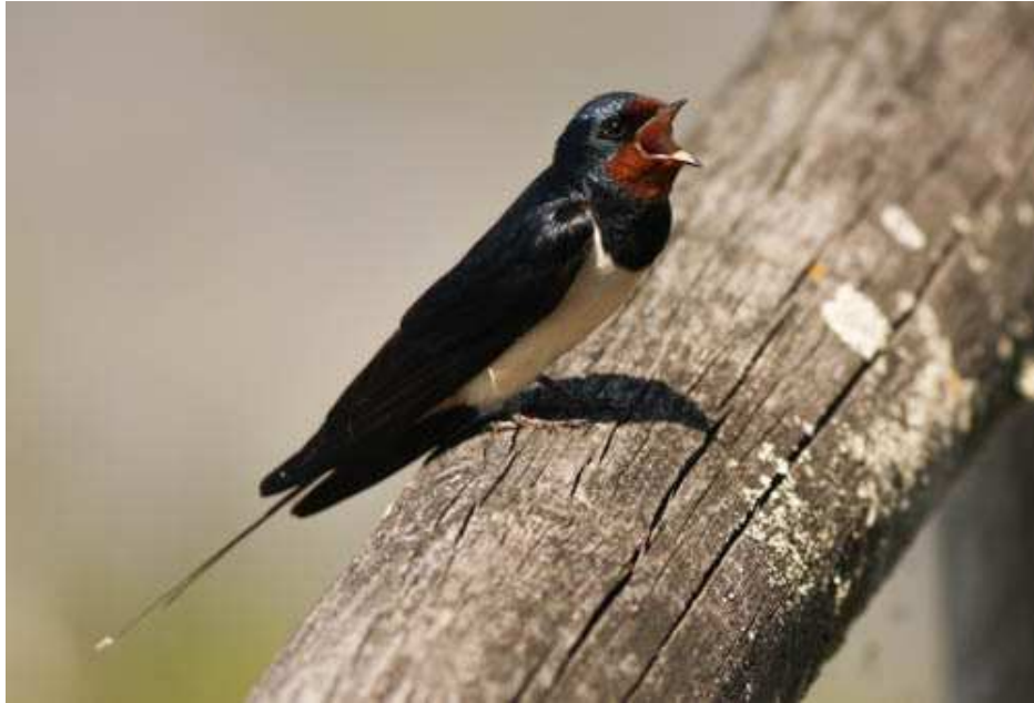
Rauchschwalbe beim Gesang