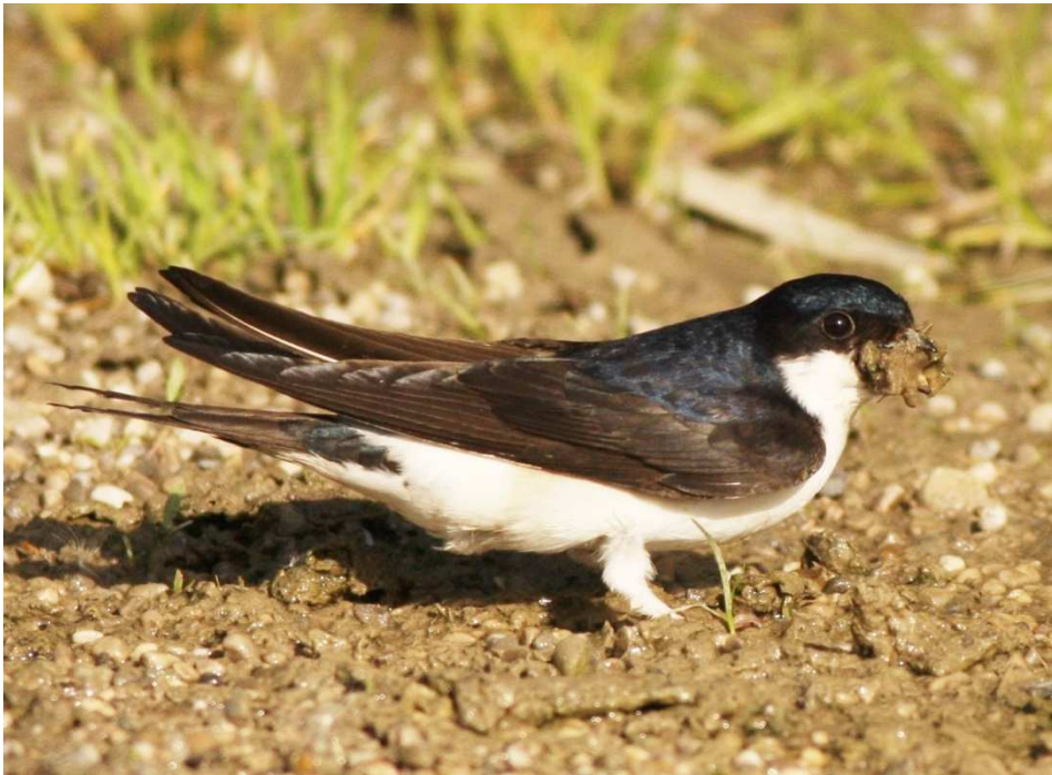
Mehlschwalbe beim Sammeln von Baumaterial (Foto: Sebastian Ludwig)