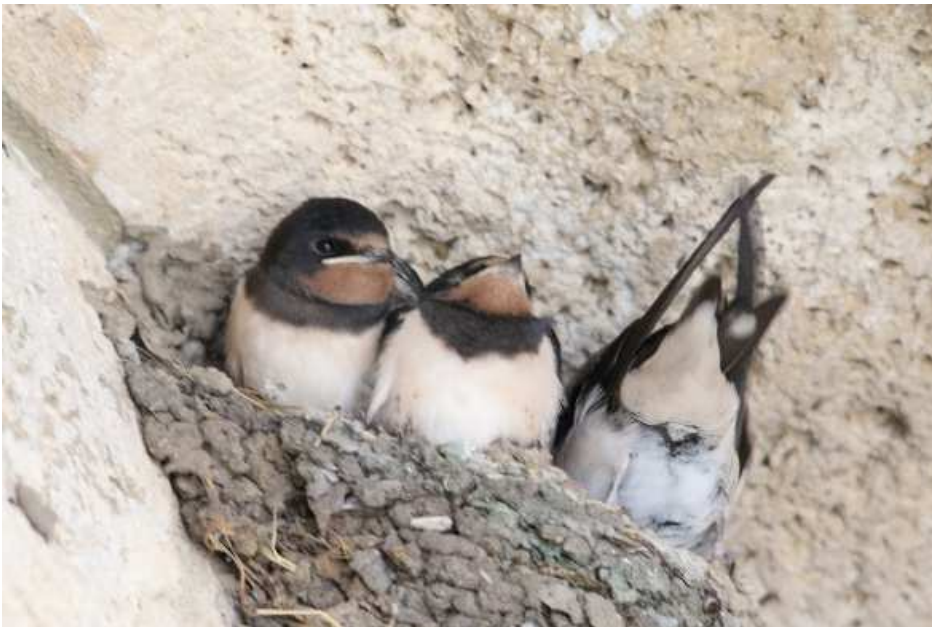
Junge Rauchschwalben kurz vor dem Flüggewerden