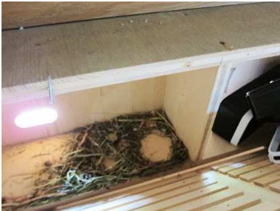
Eine Nestmulde angelegt von einem Mauersegler